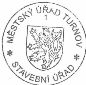
Ing. Eva Zakouřilová vedoucí stavebního úřadu

Společné povolení má podle § 94p odst. 5 stavebního zákona platnost 2 roky. Stavba nesmí být zahájena, dokud rozhodnutí nenabude právní moci.